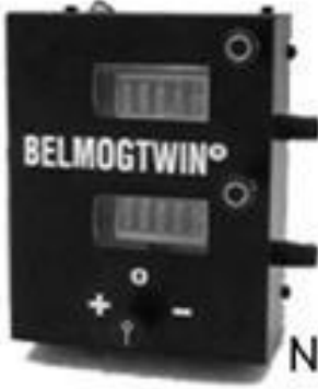
Belmogtwin MK II BELMOG New Belmogtwin